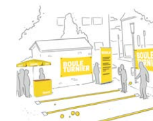
Bouleturnier „Nah dran“