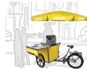
Kaffeemobil / Infostand