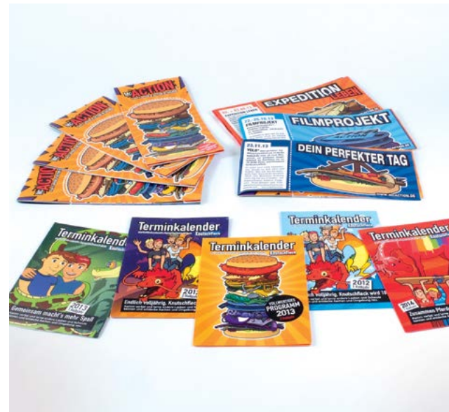
„MC AKTION“ JUGENDKULTUR