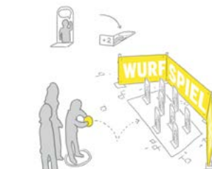
Wurfspiel „Vorurteile ausräumen“